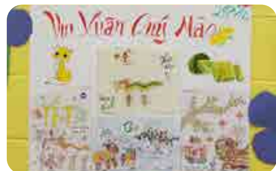
Hình vẽ Tết lớp 3 & 4