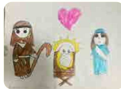
Tran Charlene, lớp 3