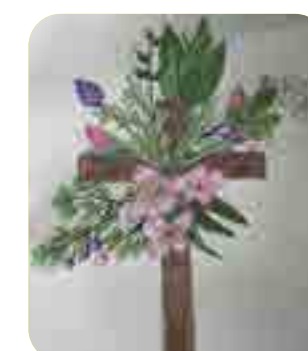
Tran Julia, lớp 4