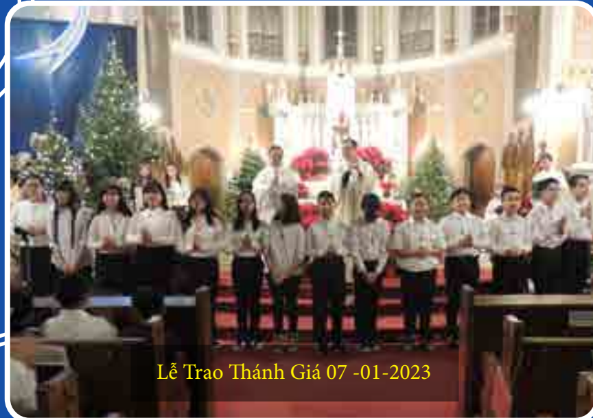
Lễ Trao Thánh Giá 07 -01-2023