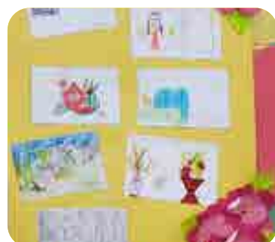
Hình vẽ Tết, lớp 2