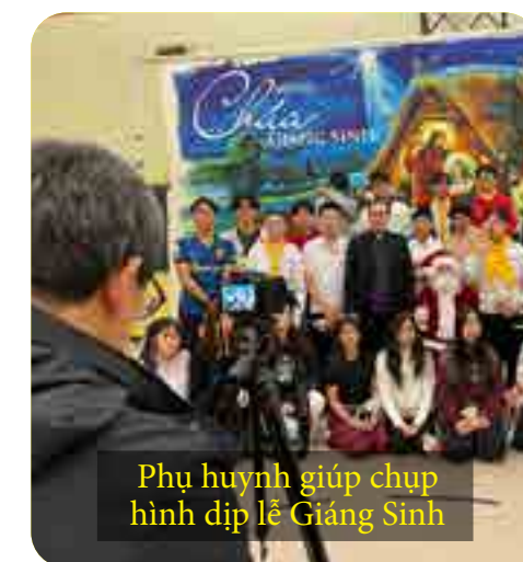
Phụ huynh giúp chụp hình dịp lễ Giáng Sinh