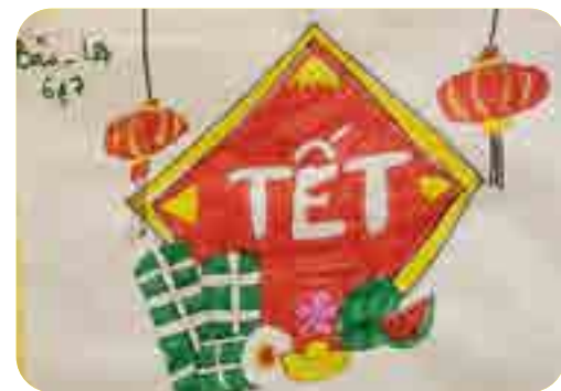
Gia Bảo, lớp 7