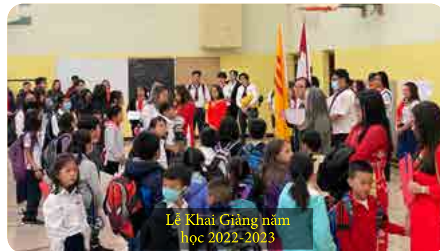
Lễ Khai Giảng năm học 2022-2023

Trường là một Bộ Phận của Giáo Xứ chúng ta. Sau buổi học chúng tôi tham gia những Sinh hoạt của GX rất thuận lợi. Cha Xứ rất quan tâm đến Trường VN hầu như mỗi tuần Cha đều đến thăm Trường; Tiếp xúc thân thiện với chúng tôi, các cháu, và giải quyết những nhu cầu cần thiết kịp thời. Ban Giám Hiệu, và Thầy Cô rất nhiệt tình, giàu kinh nghiệm trong việc quản lý và giảng dạy. Tư cách & Phong thái gương mẫu cho các cháu. Trường có Đoàn TNTT rất nhiệt tâm trong việc huấn luyện Giới Trẻ thành những người có thể chất và tinh thần sẵn sàng cho cuộc sống. Địa điểm Trường James Culnan rất thuận lợi cho Phụ huynh đi lại, cũng như các Cháu sinh hoạt Ngoại Khóa. Chúc Ban Giám Hiệu, Thầy Cô Giáo nhiều Sức Khỏe, Thành Công trong Chức Năng của mình. Thân chào,