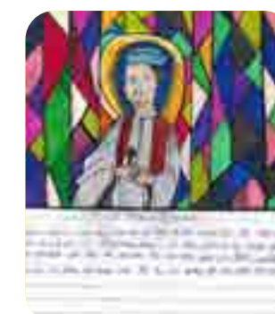
Võ Benjamin, lớp 7