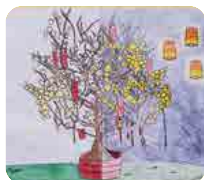
Cecilia, lớp 6 & Julia, lớp 7