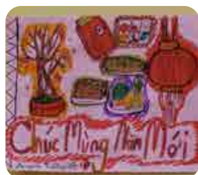
Trương Angela, lớp 6