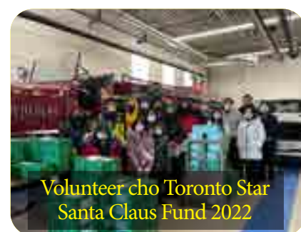
Volunteer cho Toronto Star Santa Claus Fund 2022