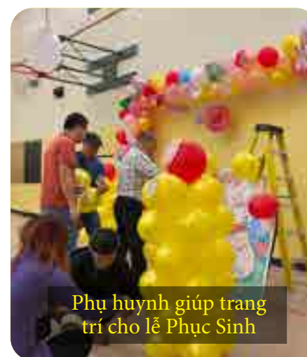
Phụ huynh giúp trang trí cho lễ Phục Sinh