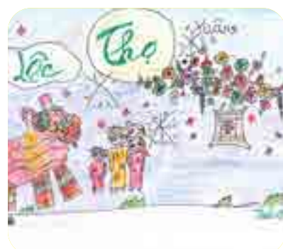
Tran Julia, lớp 4