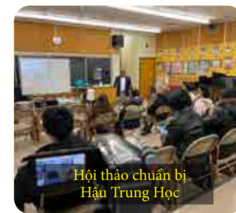
Hội thảo chuẩn bị Hậu Trung Học