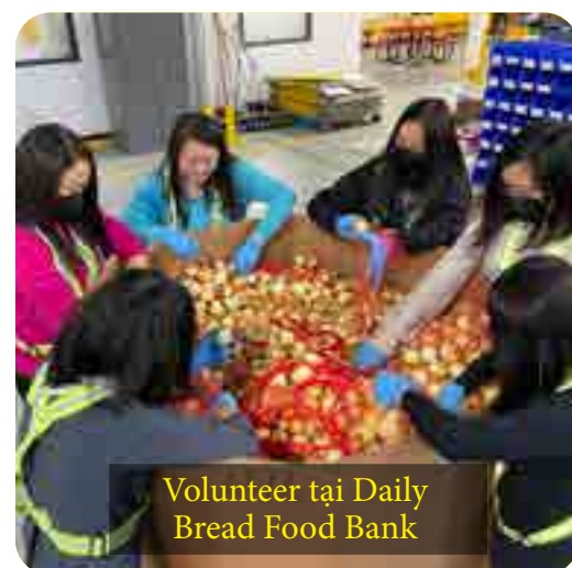
Volunteer tại Daily Bread Food Bank