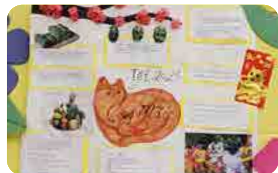
Bảo Linh, lớp 8