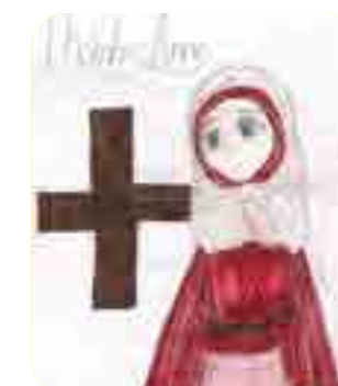
Trương Angela, lớp 7