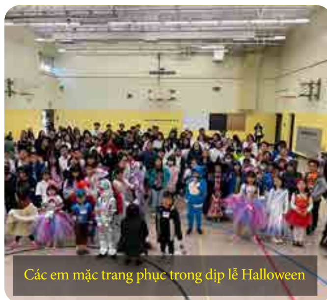
Các em mặc trang phục trong dịp lễ Halloween