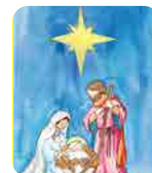
Gia Liên, lớp 7